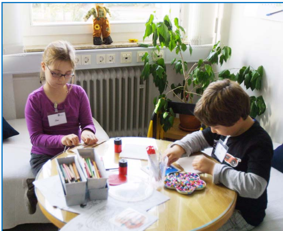
Zwischendurch werden Bügelperlenbilder angefertigt.