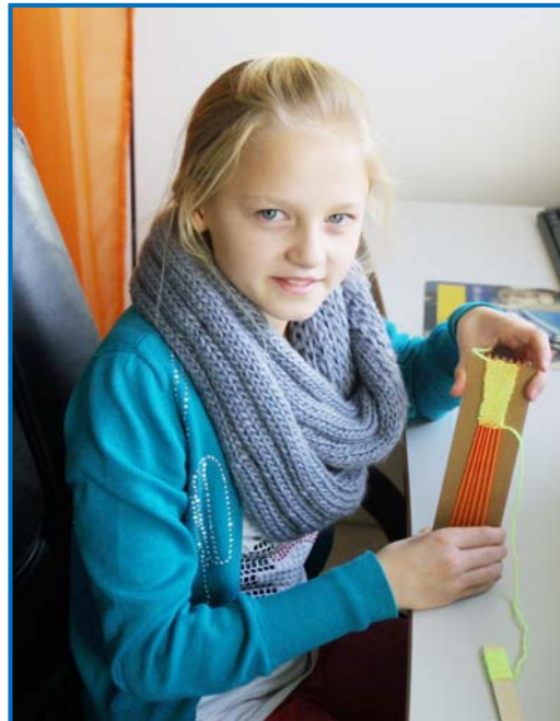
Hier werden Armbänder gewebt.