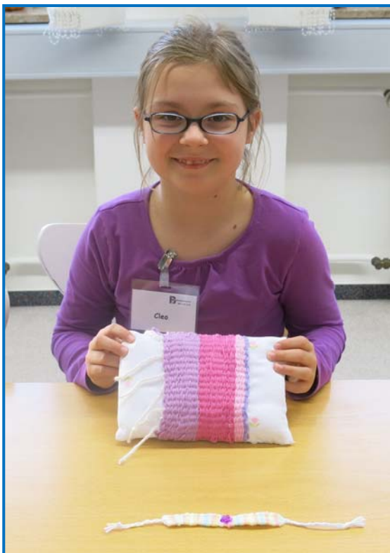
Stolz werden Kissen und Armband präsentiert!