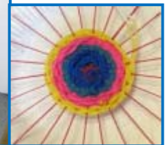
Es werden fleißig die Webstücke gestaltet.