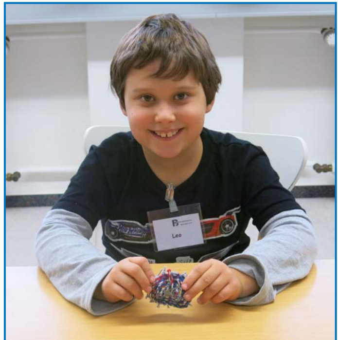
Leo und sein „Stirntuch“