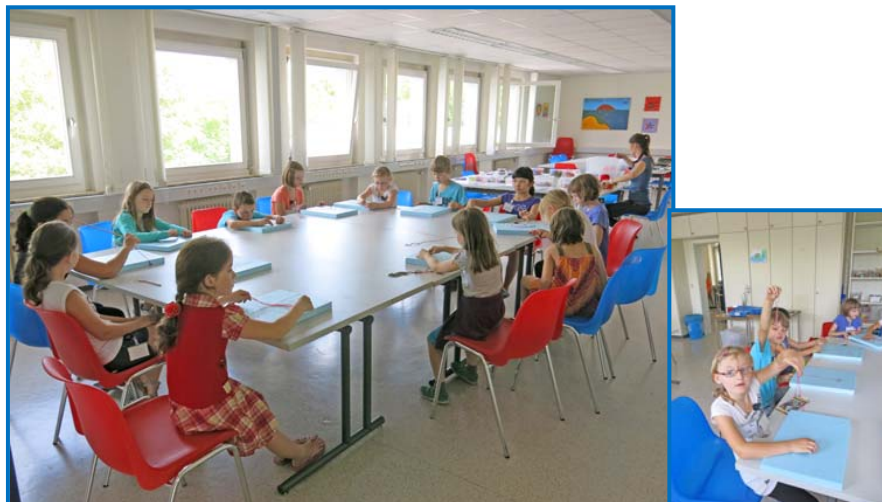
Nachdem alle die Anleitungen studiert haben, beginnt das Knüpfen der Bänder.