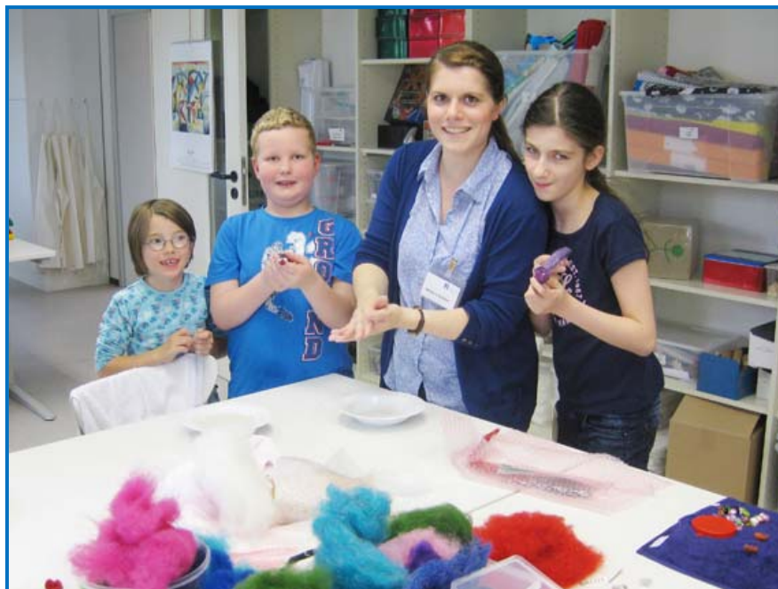
Gemeinsam filzt es sich besser...