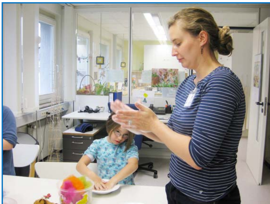
Fr. Himmel-Seele erklärt uns wie man Kugeln filzt.